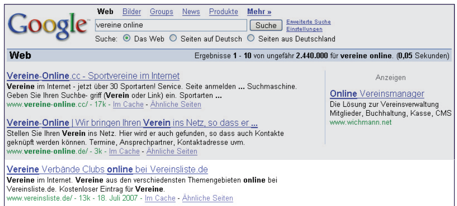
Abbildung 3: Google Suche „vereine online“ vom 19.07.2007