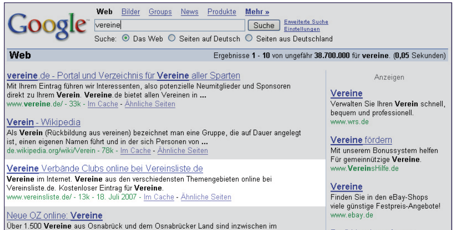
Abbildung 2: Google Suche „vereine“ vom 19.07.2007

Unser Verzeichnis ist unter Top Suchbegriffen in den führenden Suchmaschinen zu finden. Zum Beispiel finden Sie uns auf Platz 3 bei dem Suchbegriff „Vereine“ oder „Vereine online“ bei Google.de.